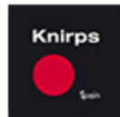
TABLA DE TALLAS · KNIRPS · ROPA IMPERMEABLE